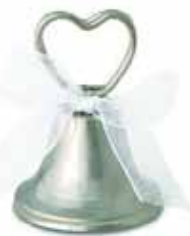
Plaatskaarhouder 'Wedding Bell', zie www.weddinggiftshop.nl

Van te voren kunnen jullie erover nadenken of jullie graag een tafelsetting willen maken. Gasten vinden het vaak wel heel erg prettig als ze weten waar ze plaats mogen nemen. En jullie kunnen ook weer goed inschatten wie goed bij wie past, dus niet dat je beste vriendin ineens naast je irritante, saai oom komt te zitten. Volgens de etiquette horen jullie (schoon)ouders en getuigen naast en tegenover jullie te zitten. Echter, doe wat jullie zelf graag willen! Tevens kunnen jullie de tafelsetting tussen de gangen door laten wisselen. Jullie -professionele- ceremoniemeester helpt jullie hier graag bij.